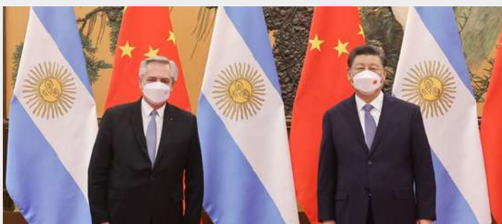
El presidente de Argentina, Alberto Fernández, en su encuentro con el presidente de China, Xi Jinping.

Para cumplir con los objetivos, el memorándum señala que se trabajará específicamente en siete áreas de cooperación : Políticas Públicas, Oportunidades de Conectividad, Conectividad e Inversiones, Integración Financiera, Intercambio entre los Pueblos, Cooperación en Terceros Mercados y Compras Gubernamentales. En mayor o menor medida, en cada uno de estos apartados se reiteran los objetivos puestos anteriormente, salvo algunas excepciones.