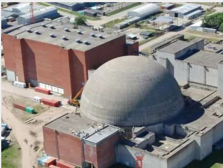
El Complejo Nuclear Atucha, en el partido de Zárate (provincia de Buenos Aires).

Si bien el Gobierno Nacional permanece confiado en que la construcción empezará a fines de año, todavía restan una serie de pasos y negociaciones que impiden predecir con exactitud cuándo iniciarán las obras. Es así que, ante un pedido de acceso a la información pública por parte del Observatorio Sino-Argentino, NA-SA denegó la posibilidad de compartir el contrato firmado con CNNC aduciendo que “la reserva del documento solicitado, en función de la sensibilidad de la información allí contenida, resulta imprescindible por cuestiones de seguridad y defensa”.