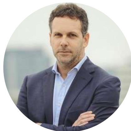
Guido Sandleris Ex Pte. del Banco Central @Gsandleris 12/05

"6% la inflación en abril, con atraso cambiario y de tarifas. A este ritmo 2022 terminaría con 96% de inflación y en un escenario optimista en 75%. Este es el resultado de un gobierno sin ideas, que financia el déficit con emisión y apuesta sólo a parches y controles para bajarla."