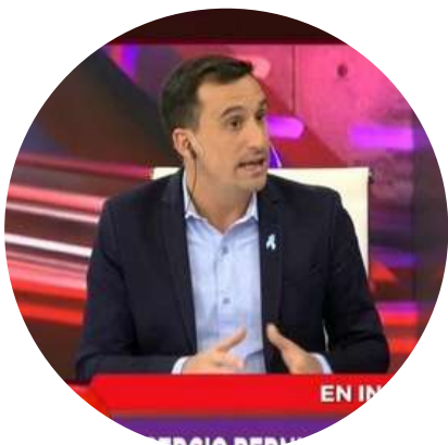
Javier Lanari Periodista (La Nación +) @javierlanari 15/12

"El Presupuesto del Gobierno destina $ 46.000 millones para subsidiar el transporte en el interior. Para el AMBA esa misma partida es de $ 216.000 millones. Federalismo? En el discurso..."