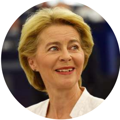
Ursula von der Leyen

Presidenta de la Comisión Europea @vonderleyen 12/12