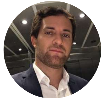
Ignacio Ortelli Periodista (Clarín) @ignacioortelli 16/12

"A 3 meses de haber asumido como jefe de Gabinete, Manzur sigue sin dar entrevistas o una conferencia de prensa a agenda abierta. No recuerdo un antecedente similar."