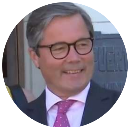
Embajador Ulrich Sante