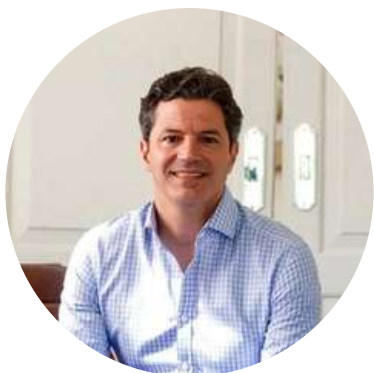
Luciano Laspina Diputado de la Nación @LaspinaL 4/11

"La "huella de carbono" de los 120 integrantes de la delegación argentina en la cumbre climática de Glasgow debe haber sido la más grande del planeta. Un papelón".