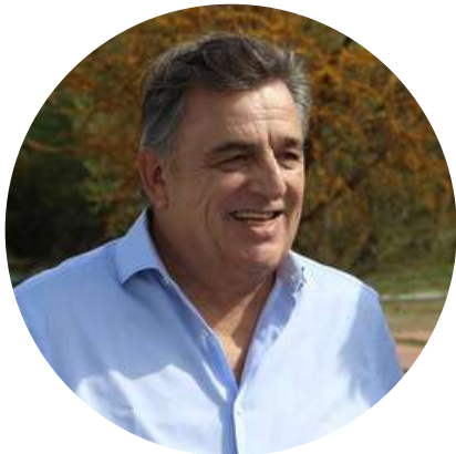
Mario Raúl Negri Diputado de la Nación @marioraulnegri 5/11

"Sólo en el mundo de Alberto Fernández se persigue un saludo con Biden en el G-20 y a los días se asiste a una reunión con Evo donde se denuncia un golpe de Estados Unidos. De yapa, el Presidente se da el lujo de criticar a la Corte Suprema por no salvar a Cristina. Indignante."