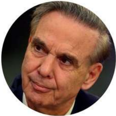
Miguel Ángel Pichetto Auditor Gral de la Nación @MiguelPichetto 21/10

"Es imprescindible que las Fuerzas Federales intervengan para poner fin al conflicto en el sur, preservar la soberanía e integridad territorial de la Nación. Los dichos del presidente son inadmisibles."