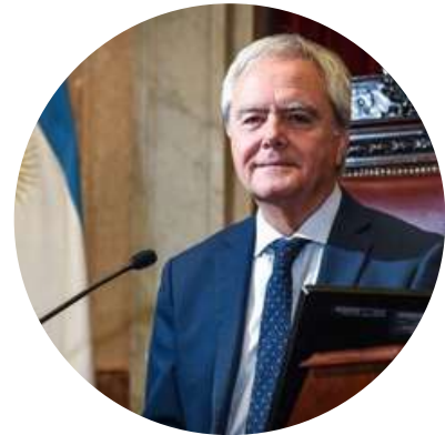
Federico Pinedo Ex Presidente del Senado @PinedoFederico 20/10

"Se me ocurre un acuerdo de precios: el gobierno deja de desvalorizar el peso y para la inflación, y todos los productos mantienen su precio."