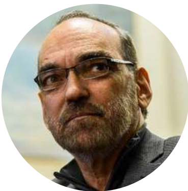
Fernando Iglesias Diputado Nacional @FerIglesias 21/10

"Funciones del gobierno nacional según el Presidente: patrullar supermercados, regalar lavarropas, financiar viajes de egresados, liberar presos, encerrar a los ciudadanos, organizar festicholas en Olivos, apretar jueces, promover la impunidad de Cristina, garantizar el garche peronista"