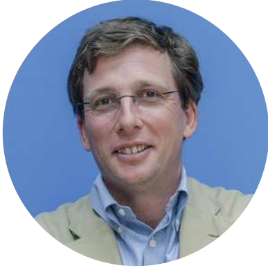
José Luis Martínez Almeida