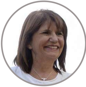
Patricia Bullrich Presidenta del PRO @PatoBullrich 09/06

"Los dueños de los gimnasios realizaron inversiones para cumplir con los protocolos, y aún así no los dejan trabajar. Impacta en la economía y en la salud física y mental de las personas. Sobre todo en los jóvenes que además están sin educación y sin libertad para circular."