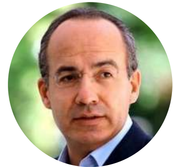
Felipe Calderón Ex Presidente de México @FelipeCalderon 09/06

"¿Qué tal la cita de Octavio Paz!? Bien "europeos" (¿será un complejo?) pero le falta un poquito de cultura al Presidente de Argentina. Acá decimos: "no tiene la culpa el indio, sino el que lo hace presidente".