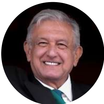
Andrés Manuel López Obrador Presidente de México @lopezobrador_ 03/06

"Hablamos con la vicepresidenta Kamala Harris. Tuvo la gentileza de informarnos, antes del anuncio que hicieron en Estados Unidos, la decisión de enviarnos un millón de vacunas Johnson & Johnson de una sola dosis. Le expresé nuestro agradecimiento en nombre del pueblo de México."