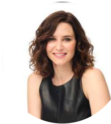
Isabel Díaz Ayuso Presidenta de la Comunidad de Madrid @IdiazAyuso 4/12

"Madrid lidera en noviembre la creación de empleo y bate récord histórico de afiliados a la Seguridad Social con 3.642.804. En lo que va de año hemos creado 134.257 puestos de trabajo. Mientras, en el resto de España se destruye empleo."