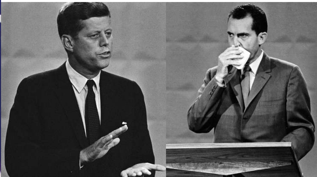
KENNEDY VS NIXON (1960): ESTE AÑO SE CUMPLEN 60 AÑOS DEL PRIMER DEBATE PRESIDENCIAL TELEVISADO EN LA HISTORIA DE LOS ESTADOS UNIDOS.

Pronto podremos continuar analizando estas dos marcas en los próximos debates. Los invito a que vean a estos contendientes como marca y no como candidatos políticos. ¿Cambiaría esto su decisión de compra?