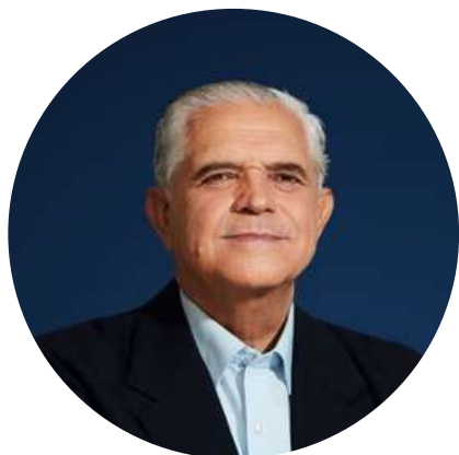
Ricardo López Murphy Diputado Nacional @rlopezmurphy 13/11

"142,7% de inflación acumulada son miles de familias dejando productos en la caja del supermercado porque el sueldo no alcanza. El responsable se llama Sergio Tomas Massa, y es candidato a presidente del kirchnerismo. Acordate el domingo."