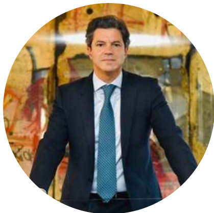
Luciano Laspina Diputado Nacional @LaspinaL 13/11

"Quiero recordar que el 19 de noviembre a las 12 de la noche la "estabilidad económica" que hoy presumen los medios oficialistas (10-15% de inflación mensual y recesión) se convierte en "calabaza". La crisis que engendró el cuarto kirchnerismo será de las más duras de la historia."