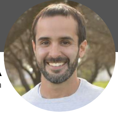
MARTÍN MAQUIEYRA Diputado Nacional por La Pampa