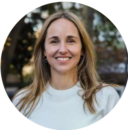
Clara Muzzio Candidata a Vicejefa de Buenos Aires @claramuzzio 22/9

"Para garantizar el pleno desarrollo de todos los chicos vamos a penalizar a las organizaciones sociales que se movilizan con ellos como rehenes o escudo humano."