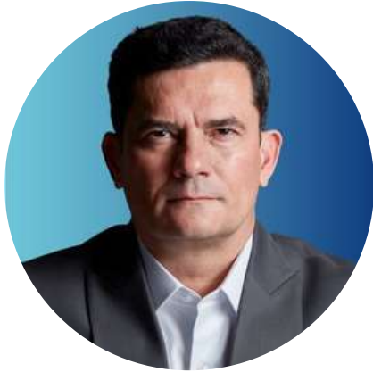
Sergio Moro Senador de Brasil @SF_Moro 16/9

"Visita de Lula à Cuba para criticar embargo norteamericano e adular a ditadura, nenhuma palavra sobre liberdade, democracia e direitos humanos violados pelo regime. Nada mudou."