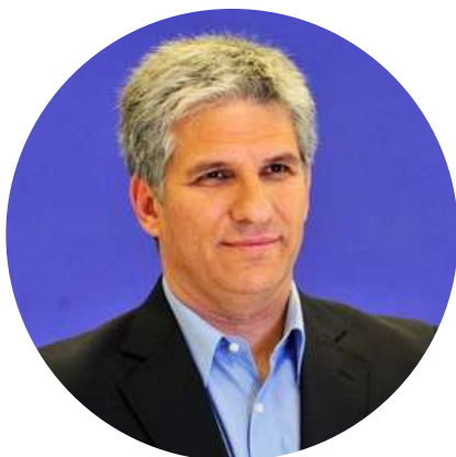
Claudio Javier Poggi Gobernador electo de San Luis @claudiojpoggi 7/9

"El gobernador saliente @alberto_rsaa tomó la decisión de vaciar las arcas provinciales, retirando los últimos U$S88M de reservas que el Estado Provincial tenía en caja de seguridad. Culmina su mandato dejando a San Luis sin fondos y comprometiendo recursos de presupuestos futuros"