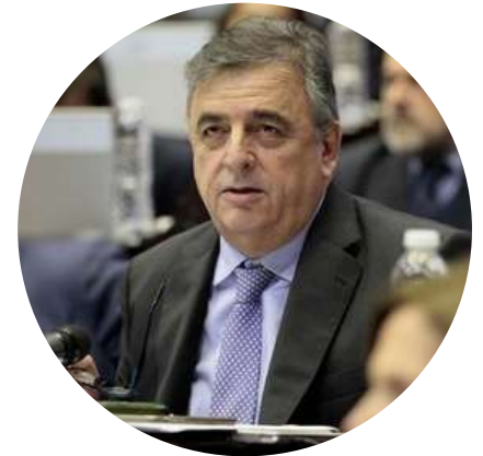
Mario Raúl Negri Diputado Nacional @marioraulnegri 6/9