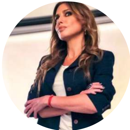
Guadalupe Vazquez Periodista @guadavazquez 29/8

"Rebelión provincial. Nueve gobernadores (que ya hicieron sus campañas) se le pararon de manos a Sergio Massa por el bono a estatales. No le quieren "hacer la campaña" con las arcas provinciales. Ojo, no es un ataque repentino de "responsabilidad fiscal": Aprovechan para presionar al ministro por más fondos. Como dice la máxima: El peronista te acompaña a la puerta del cementerio pero no entra."