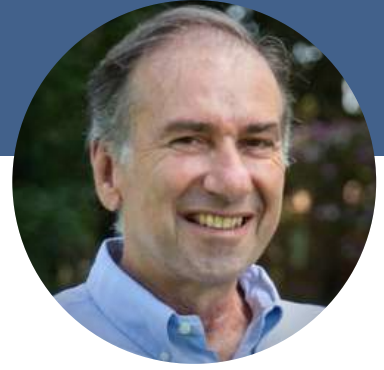
HUMBERTO SCHIAVONI Senador de la Nación por Misiones