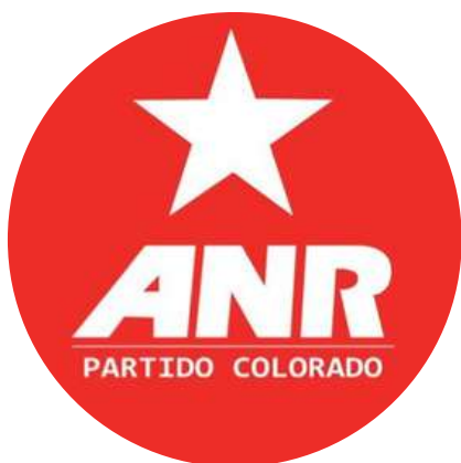
Asociación Nacional Republicana @ANRParaguay 15/8

"Desde la Asociación Nacional Republicana, Partido Colorado, deseamos éxitos al nuevo gobierno que asume hoy @SantiPenap y @AllianaPedro . Que sean 5 años de prosperidad para el Paraguay."