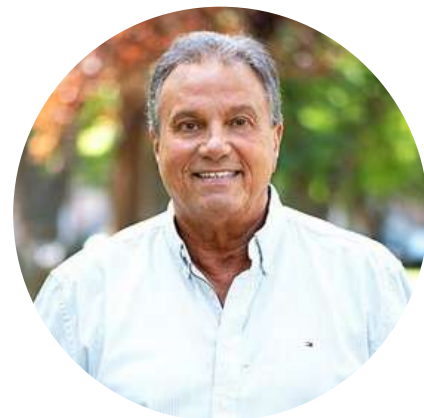
Carlos Eguia Periodista @CarlosEguiaUno 3/8

"Hoy 3 de agosto se cumple 1 año de Sergio Massa como Ministro de Economía. ¿El resultado? 3.332.637 nuevos pobres, el dólar pasó de $290 a $560 y la inflación interanual de 71% a 116%. En un país normal Massa ya hubiese renunciado. En Argentina, es candidato a presidente."