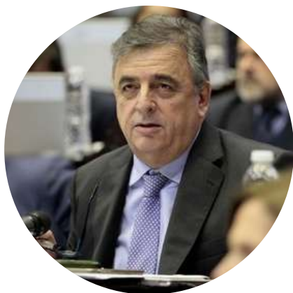
Mario Raúl Negri Diputado Nacional @marioraulnegri 3/8

"Desde que Sergio Massa "agarró una papa caliente" el dólar oficial pasó de $ 138 a $ 288, el blue de $ 298 a $ 560, la inflación de 71 % a 116 %, la deuda total aumentó el equivalente a u$s 25.270 millones y la actividad económica cayó de +6.4 % a -5.5 %. Quemó la papa. "