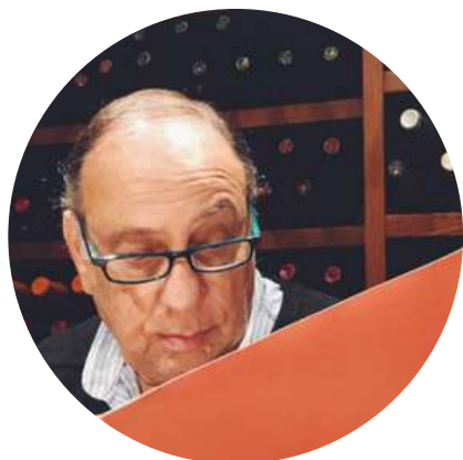
Roberto Cachanosky Economista @RCachanosky 3/8

"Hace un 1 año asumía Massa el cargo de Ministro de Economía. En este año llevó la inflación al 115% anual, el blue subió el 122% y el BCRA está vacío de reservas. No hay dólares para importar insumos y la economía tiende a paralizarse Salimos de Guatemala y nos metimos en Guatepeor"