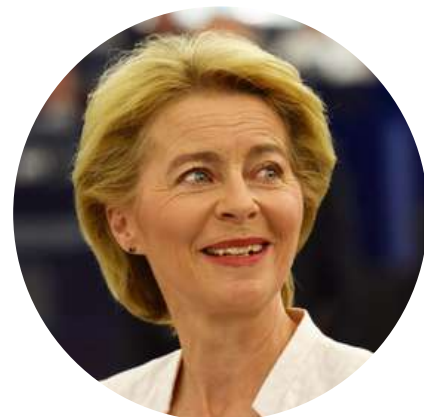
Ursula von der Leyen President of the EU Commission @vonderleyen 13/6

"EU-Mercosur is the largest, most ambitious trade agreement our regions have negotiated. A combined market of 700 million consumers – the potential for economic progress is immense! We need to get it done. I count on as current Mercosur chair."