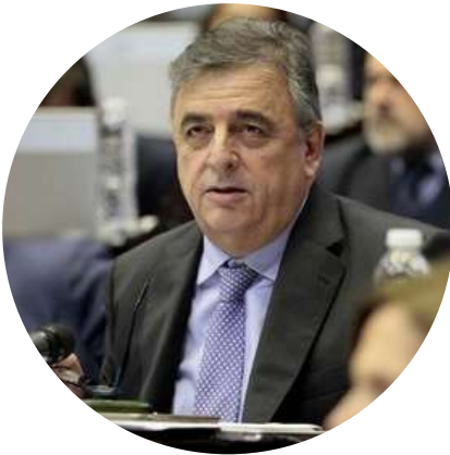
Mario Raúl Negri