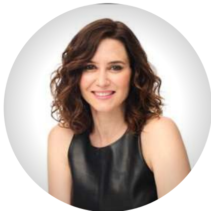
Isabel Díaz Ayuso