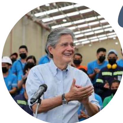
Guillermo Lasso Presidente de Ecuador @LassoGuillermo 11/5

"Otra buena noticia para el Ecuador. Hoy firmamos el acuerdo comercial con China que nos abre un mercado de 1400 millones de consumidores. El crecimiento de exportaciones no petroleras será entre 3.000 y 4.000 millones de dólares adicionales a los que ya comerciamos. Paulatinamente, el 99.6 % de nuestras exportaciones entrarán con 0 % de arancel al país asiático."