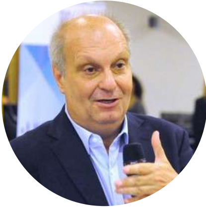
Hernán Lombardi Diputado Nacional @herlombardi 12/5

"20 años de populismo kichnerista nos trajeron hasta acá: 8,4 % de inflación mensual. Es un modelo político y económico basado en relatos anticuados que demostraron su fracaso absoluto. El ocaso del kirchnerismo es el ocaso de sus ideas."