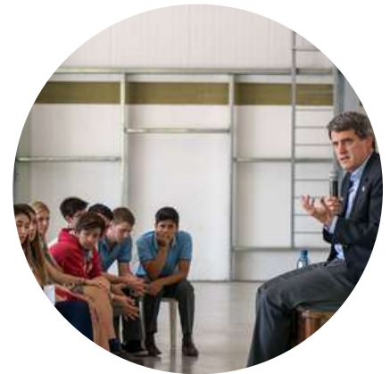
Alfonso Prat-Gay Economista @alfonsoprattgay 12/5

"140% anual de inflación; Pobreza arriba del 40%; Brecha del 100%; Reservas negativas. Rajan al Ministro de Economía? No. #Los3Chiflados lo prefieren de candidato a presidente. "