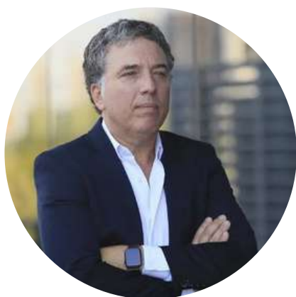
Nicolás Dujovne Ex ministro de economía @NicoDujovne 4/5

"Inflación apuntando al 150%, pobreza al 50%, tasas de interés y riesgo país batiendo récords, reservas en 0 (cero). El Presidente? Escondido. La Vice? Subiendo videitos editados. ¿PROBARON CON HACERSE CARGO DE SU GOBIERNO?"