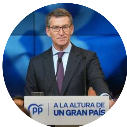
Alberto Núñez Feijóo Presidente del PP @NunezFeijoo 5/5

"España necesita un Gobierno unido y tranquilo. En el que la gestión y la experiencia sean prioritarios. En el que importen los compromisos y la palabra dada. Un Gobierno de mayorías, de moderación y que gobierne para todos."