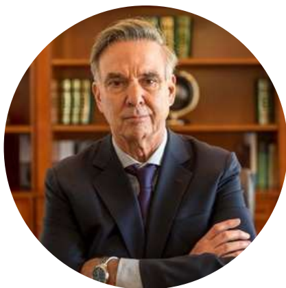
Miguel Ángel Pichetto Auditor General de la Nación @MiguelPichetto 28/3

"El principal problema de la Argentina hoy es político. La palabra presidencial perdió autoridad. Hay que revalorizar los conceptos básicos. El principal desafío es volver a ordenar el país. Siempre lo dije."