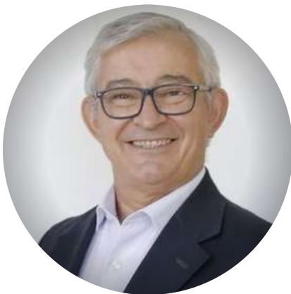
Martín Grande Ex Dip. de la Nación @MartinGrandeOK 01/12

"Mientras todos aplaudimos y nos copamos con la selección Nacional @alferdez se gasta 7 mil millones en el nuevo avión presidencial... Con un 50% de ciudadanos pobres y casi un 20% en la indigencia Son lo peor de la historia."