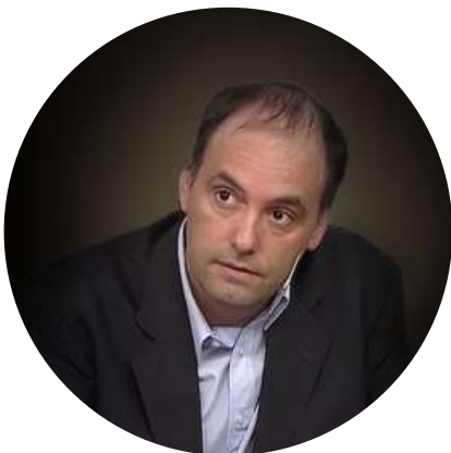
Manuel Adorni Economista @madorni 08/09

"La fortuna de la Reina Isabel II se estima en 600 millones USD. Equivale al 60% de lo que se la acusa a CFK de haber desviado con las obras públicas en Santa Cruz. Lázaro Báez tiene una fortuna de 205 millones USD, equivalente a un tercio de toda la fortuna de la Reina. Fin."