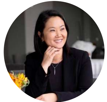
Keiko Fujimori Pte. del Partido Fuerza Popular de Perú @keikofujimori 05/09

"El pueblo chileno le ha dado ayer al mundo una lección de madurez democrática. Le ha dicho NO a un intento de refundación radical y confrontacional. Una excelente referencia para que los peruanos entendamos que nunca es demasiado tarde para retomar el camino correcto."