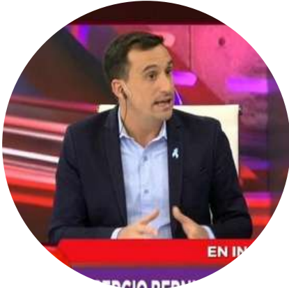
Javier Lanari Periodista @javierlanari 08/09

" En el Reino Unido vienen trabajando el protocolo del funeral de Isabel II hace más de 60 años. A nadie se le ocurrió agregar el ítem del feriado ni de la suspensión de clases. Pasaron seis décadas. Se les escapó..."