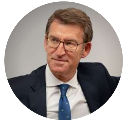
Alberto Núñez Feijóo Pte. del Partido Popular @NunezFeijoo 15/06

"Andalucía se está convirtiendo en uno de los motores económicos de España. Pedimos el voto para @JuanMa_Moreno, para no quebrar el modelo de prosperidad de esta tierra y para que haya un presidente que pueda gobernar sin intermediarios con la fortaleza electoral de las urnas"