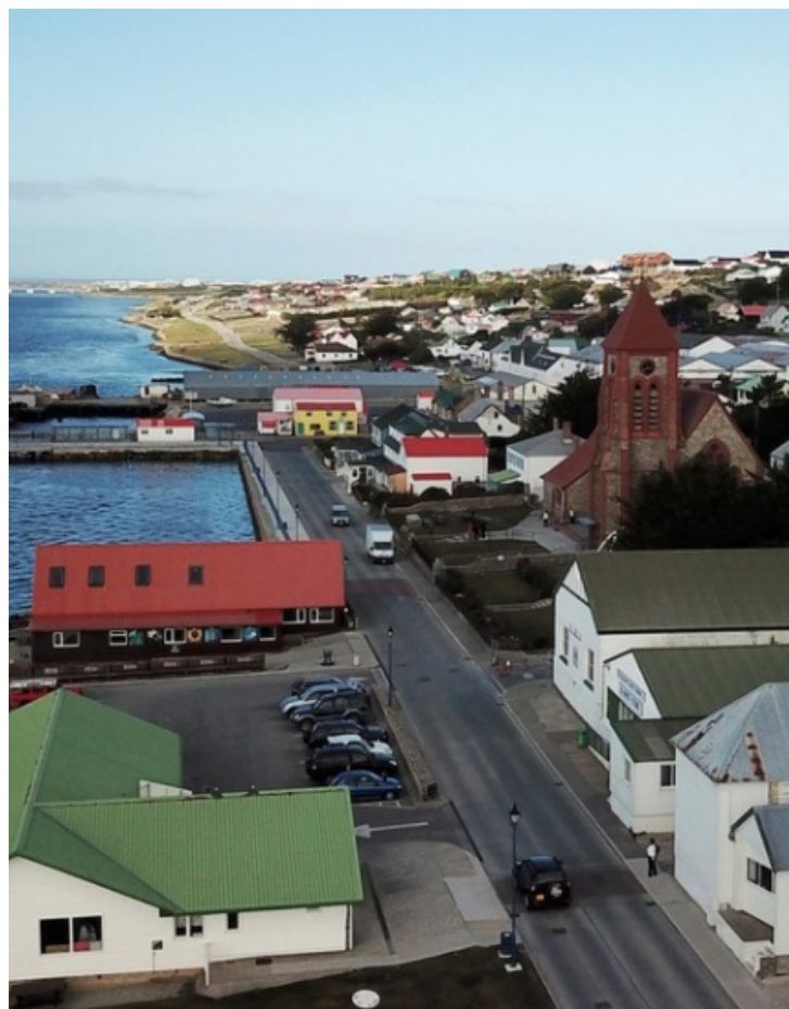
Puerto Argentino, Islas Malvinas.

En otro orden, es destacable que el acuerdo entre el RU y la UE no incorporó ninguna de las alternativas que se barajan para fortalecer los aspectos ambientales de la asociación con el Mercosur. Efectivamente, los dos principales compromisos que el gobierno francés insiste que se deben fortalecer (deforestación ilegal y adhesión al Acuerdo de París) comparten el mismo mecanismo de solución de conflictos en ambos tratados: las partes realizan consultas mutuas y, en caso de no tener éxito, se acude a un panel de expertos que emite una recomendación. Lo único que se agrega en el acuerdo entre el RU y la UE es que si alguna de las dos entidades reduce sus estándares ambientales en aras de ganar mayor competitividad, la parte afectada puede solicitar una compensación temporaria o, en su defecto, dejar de cumplir una obligación equivalente. Si bien la Comisión Europea y los gobiernos del bloque ya han aceptado el acuerdo de salida del RU, falta conocer si estas cuestiones ambientales provocarán algún tipo de controversia en el Parlamento Europeo.