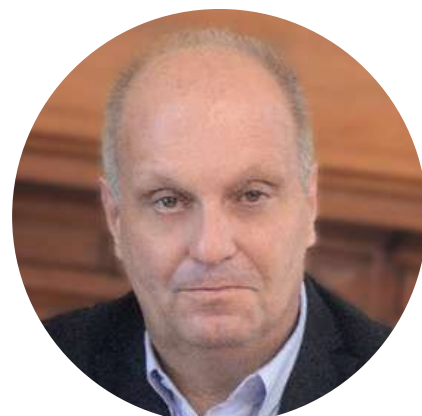
Hernán Lombardi Diputado Nacional @herlombardi 18/4

"Dolar a 420. El ocaso del kirchnerismo es el ocaso de sus ideas. Anacrónicos, no entienden absolutamente nada del mundo actual y son una máquina de generar pobres y expulsar jóvenes."